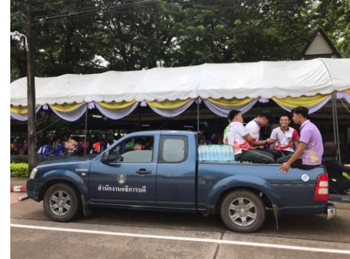
มีเจ้าหน้าที่ให้บริการน้ำดื่มตามจุดพักญาติผู้สำเร็จการศึกษา