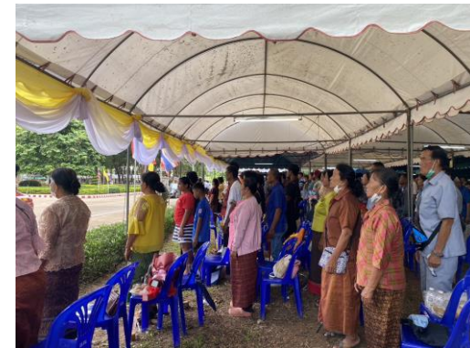
บริเวณริมถนนหน้าหอประชุมมหาวิทยาลัยราชภัฏวชิราลงกรณถึงอาคาร 10 มีญาติผู้สำเร็จการศึกษา รอต้อนรับขบวนผู้แทนพระองค์