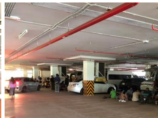
ญาติผู้สำเร็จการศึกษา พักผ่อนบริเวณโรงจอดรถอาคาร 20