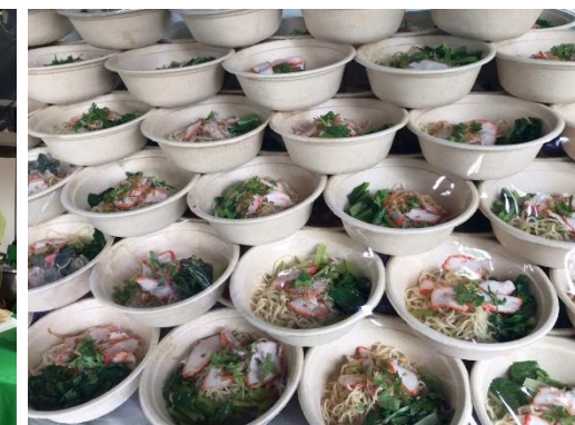
จุดบริการอาหารพระราชทาน