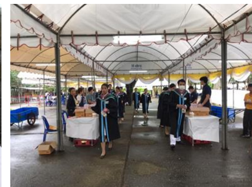
มีบริการอาหารเข้าแก่ผู้สำเร็จการศึกษาบริเวณ หน้าหอประชุมจามจุรี