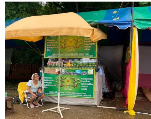
ร้านจำหน่ายสมุนไพร ใช้เครื่องเสียงโฆษณาสินค้าเสียงดัง