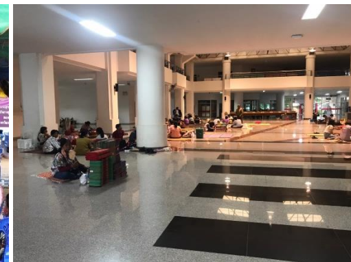
จุดพักญาติทุกจุดมีญาติผู้สำเร็จการศึกษาหนาแน่น