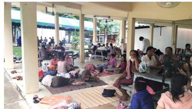
ญาติผู้สำเร็จการศึกษาพักผ่อนใต้อาคารหนาแน่น