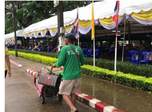
พบการหาบเร่แผงลอยบริเวณโดยรอบมหาวิทยาลัย