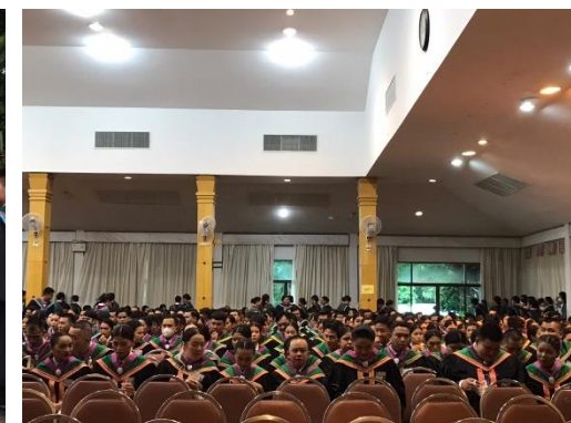
การเข้าแถวของผู้สำเร็จการศึกษาทั้งภายนอกและภายในหอประชุมจามจุรี 1