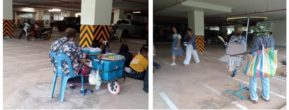
พบการหาบเร่แผงลอยบริเวณโดยรอบมหาวิทยาลัย

พบการหาบเร่แผงลอยบริเวณโดยรอบมหาวิทยาลัย เช่น เสื้อ ของเล่นเด็ก ลอตเตอรี่ เป็นต้น