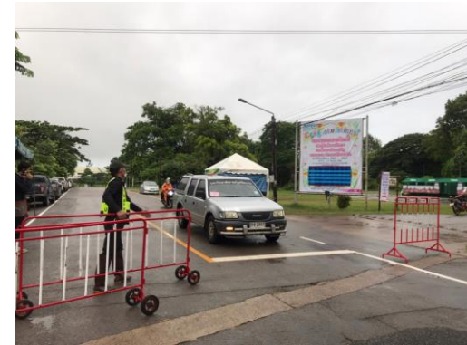
มีเจ้าหน้าที่อำนวยความสะดวกทุกจุด