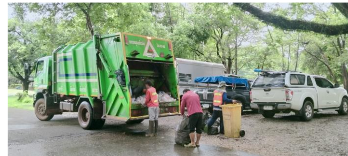
มีเจ้าหน้าที่และรถเก็บขยะจากเทศบาลนครสกลนคร