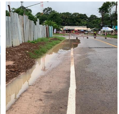
บริเวณสนามหญ้าประตู 2, จุดก่อสร้างอาคาร 6 ยังมีน้ำขัง