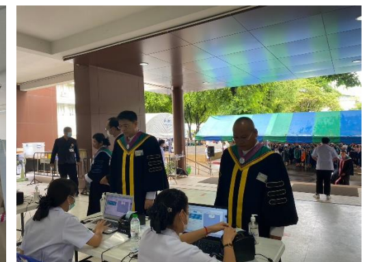
จุดตรวจ ATK หน้าอาคาร 13 เป็นระเบียบเรียบร้อย