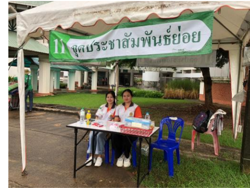
จุดประชาสัมพันธ์ย่อยทั่วมหาวิทยาลัย

การเข้าแถวและเดินแถว ของผู้สำเร็จการศึกษา