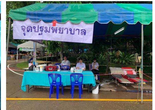
มีเจ้าหน้าที่ประจำจุดปฐมพยาบาลโดยรอบมหาวิทยาลัย