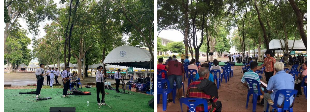
มีการแสดงดนตรีบริเวณสนามหญ้า หน้าหอประชุมจามจุรี 1