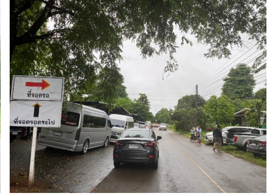
บริเวณประตู 2, 4, 5 และ 6 การจราจรคล่องตัว (ต่อ)