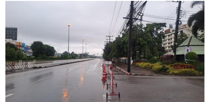
มีฝนตก ช่วงสายท้องฟ้ามีดครึ้ม ฝนตกปรอยๆ เย็นสบาย