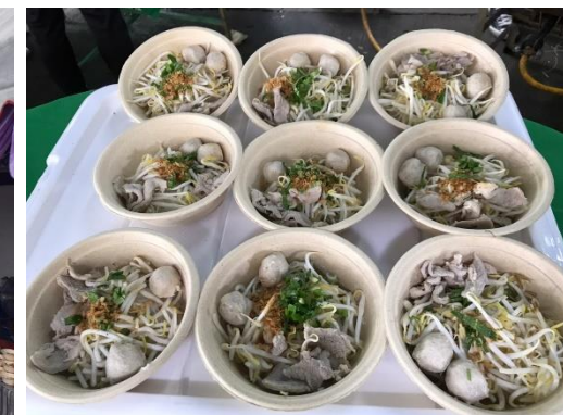
จุดบริการอาหารพระราชทาน