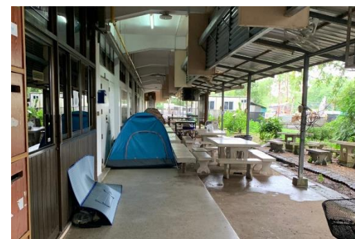
ญาติผู้สำเร็จการศึกษาพักผ่อนใต้อาคารหนาแน่น