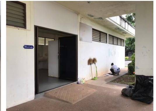
ห้องน้ำตามอาคารเพียงพอต่อการใช้งาน สะอาด