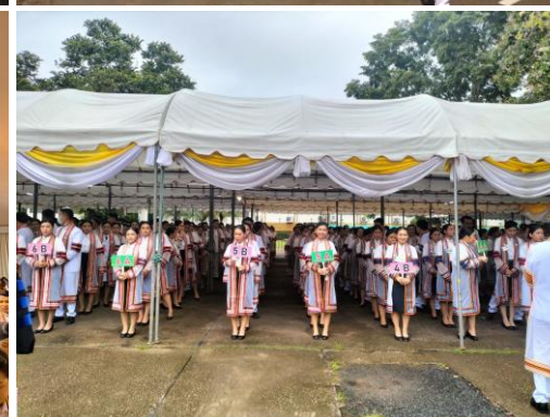
การเข้าแถวของผู้สำเร็จการศึกษา