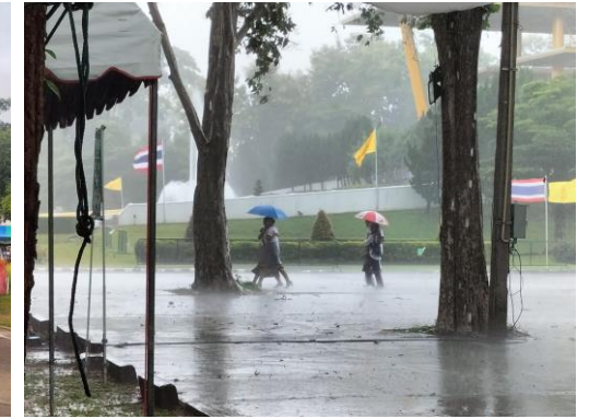
ช่วงเช้าอากาศดี เย็นสบาย ช่วงเวลา 11.30 น. มีฝนตกหนัก