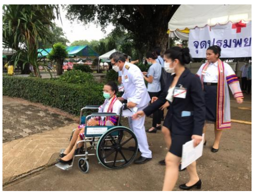
บริการรถเข็นผู้ป่วยและพิการ

4) ห้องน้ำตามอาคารเพียงพอต่อการใช้งาน สะอาด และมีเจ้าหน้าที่ดูแลความสะอาดทุกจุดบริการ