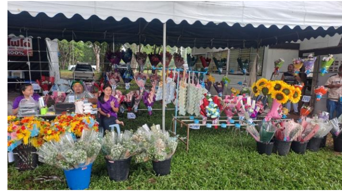
ร้านค้าตัดป้ายราคาชัดเจน