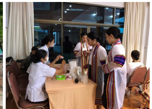
จุดปฐมพยาบาล