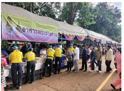
อาหารพระราชทาน