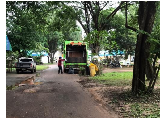
รถเก็บขยะจากเทศบาลนครสกลนคร