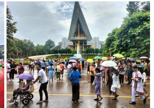
จุดถ่ายภาพบริเวณวงเวียนน้ำพุและหน้าหอประชุมมหาวิทยาลัยราชภัฏนคร