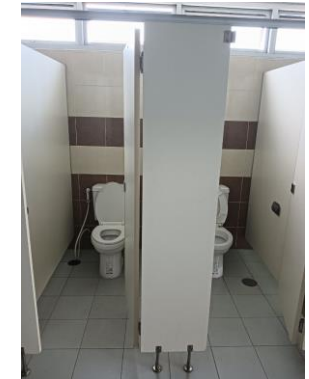
ห้องน้ำตามอาคาร