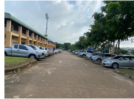
จุดจอดรถของญาติผู้สำเร็จการศึกษา