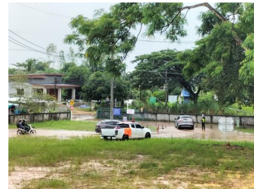
มีน้ำท่วมขังบริเวณประตู 5 และ ประตู 6