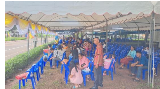
ญาติผู้สำเร็จการศึกษา รอต้อนรับขบวนผู้แทนพระองค์