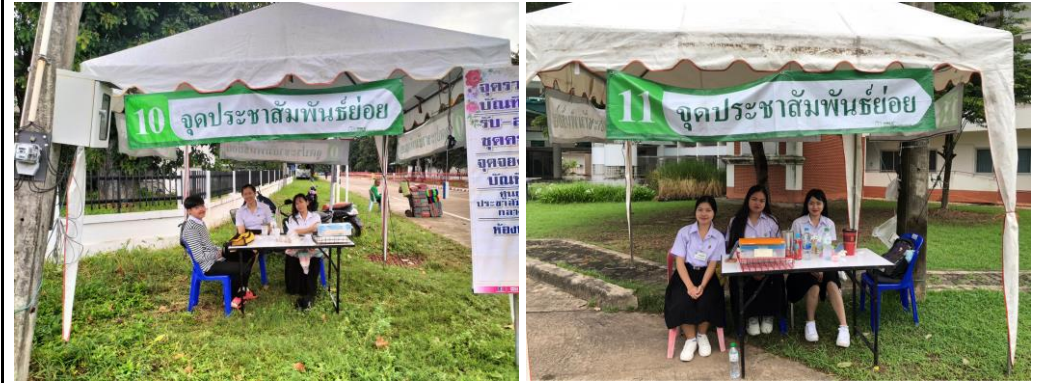
จุดประชาสัมพันธ์ย่อย