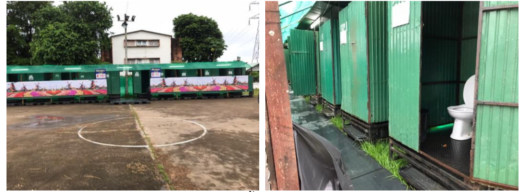
ห้องน้ำชั่วคราว

5) มีเจ้าหน้าที่และรถเก็บขยะจากเทศบาลนครสกลนคร เก็บขยะสม่ำเสมอโดยรอบมหาวิทยาลัย